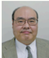
一般社団法人山口県柔道協会 会長